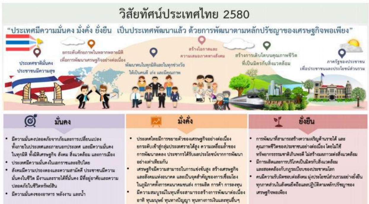
ภาพที่ ๒.๑ วิสัยทัศน์ประเทศไทย ๒๕๘๐

“ประเทศไทยมีความมั่นคง มั่งคั่ง ยั่งยืน เป็นประเทศพัฒนาแล้ว ด้วยการพัฒนาตามหลักปรัชญาของเศรษฐกิจพอเพียง”